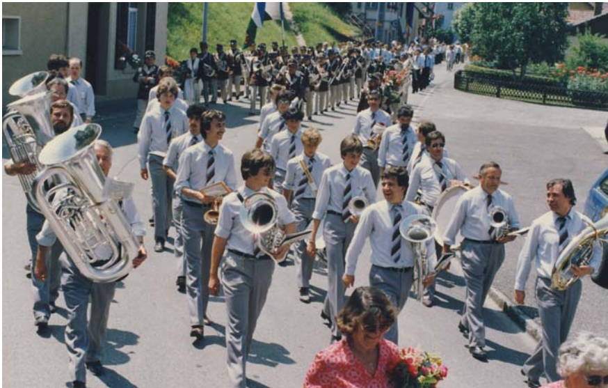
Am Sonntagmittag formierte sich bei schönstem Wetter ein Dorfumzug mit den Dorf- und Gastvereinen.