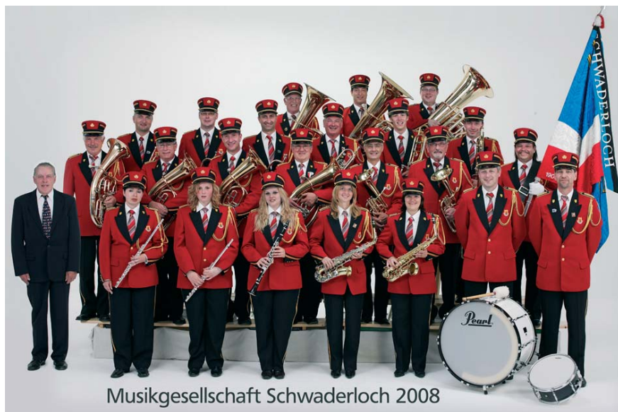
Musikgesellschaft Schwaderloch 2008