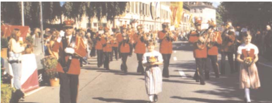
2002 – Evolutionsaufführung am Musiktag Mettau (zweiter Rang) und in Aarau

Sechs Getzen-Trompeten, fünf Yamaha-Flügelhörner und drei King-Posaunen wurden noch kurz vor weiteren Preisaufschlägen bestellt. Durch das registerweise Austauschen der Instrumente kann eine ausgeglichene Stimmung im Spiel erzielt werden. Es ist uns somit auch möglich, die Jungbläser mit eigenen, revidierten Instrumenten auszurüsten. Im Hinblick auf das Kantonale Musikfest in Baden und auf das