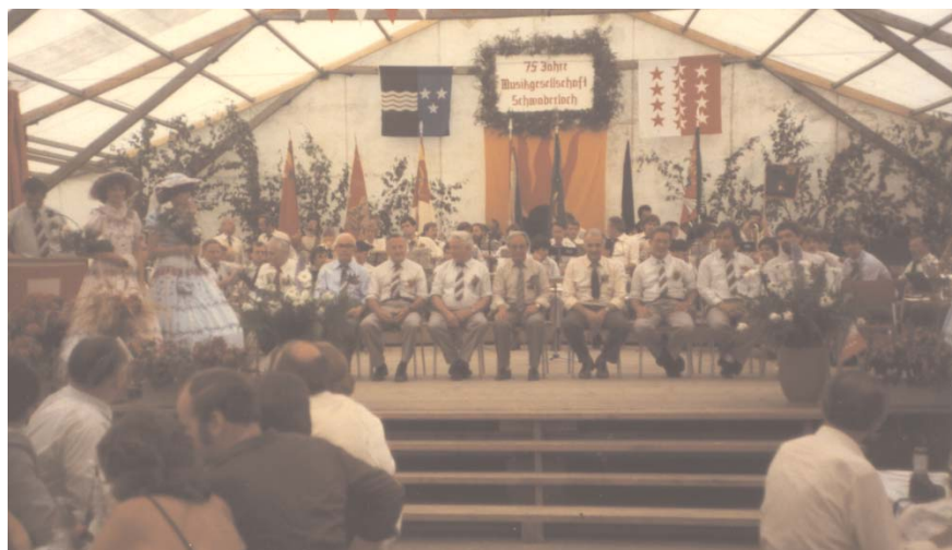
Festakt am Sonntagmittag beim 75-jährigen Jubiläum