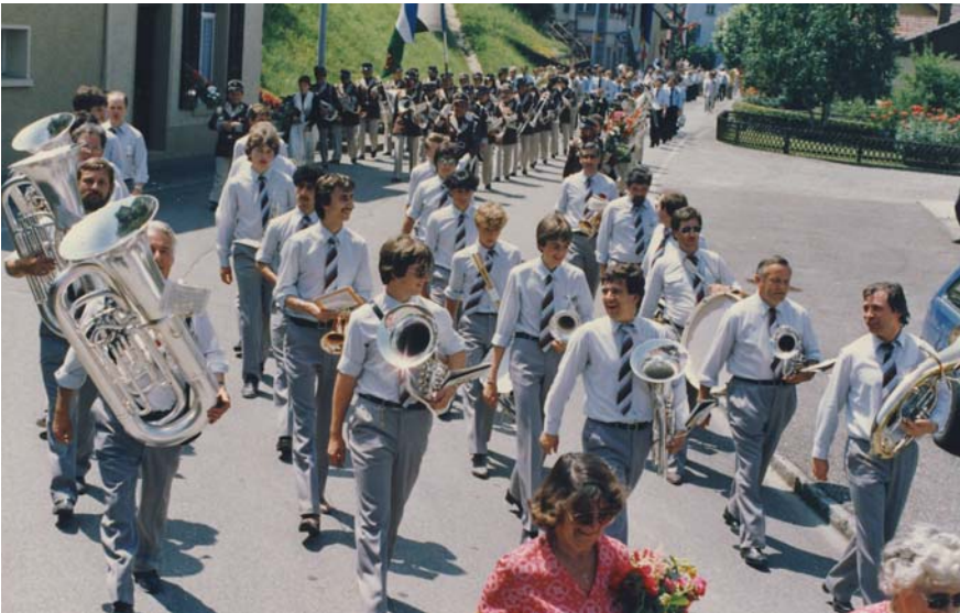
Am Sonntagmittag formierte sich bei schönstem Wetter ein Dorfumzug mit den Dorf- und Gastvereinen.