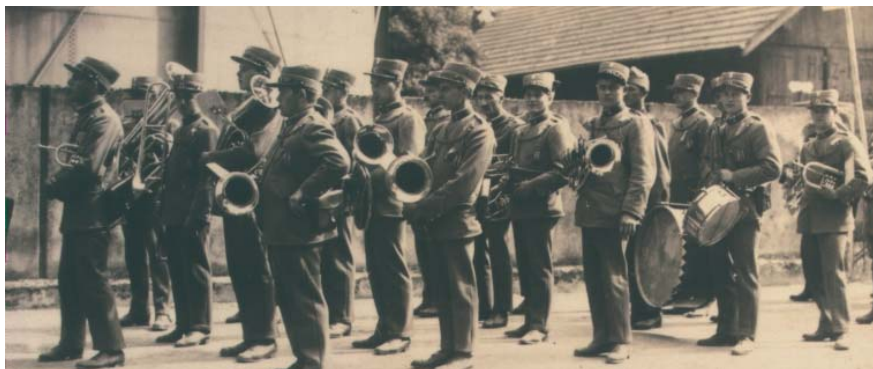
Am ersten kantonalen Musikfest in Sulz 1928 ist warten angesagt.

unterzeichnet werden mussten. Im darauffolgenden Jahr konnte dann unser Verein seine ersten Uniformen zum Preise von 158 Franken per Stück bei der Firma Dick in Bern kaufen. Zur damaligen Zeit hatten vielleicht ein Drittel aller Vereine eine Uniform.